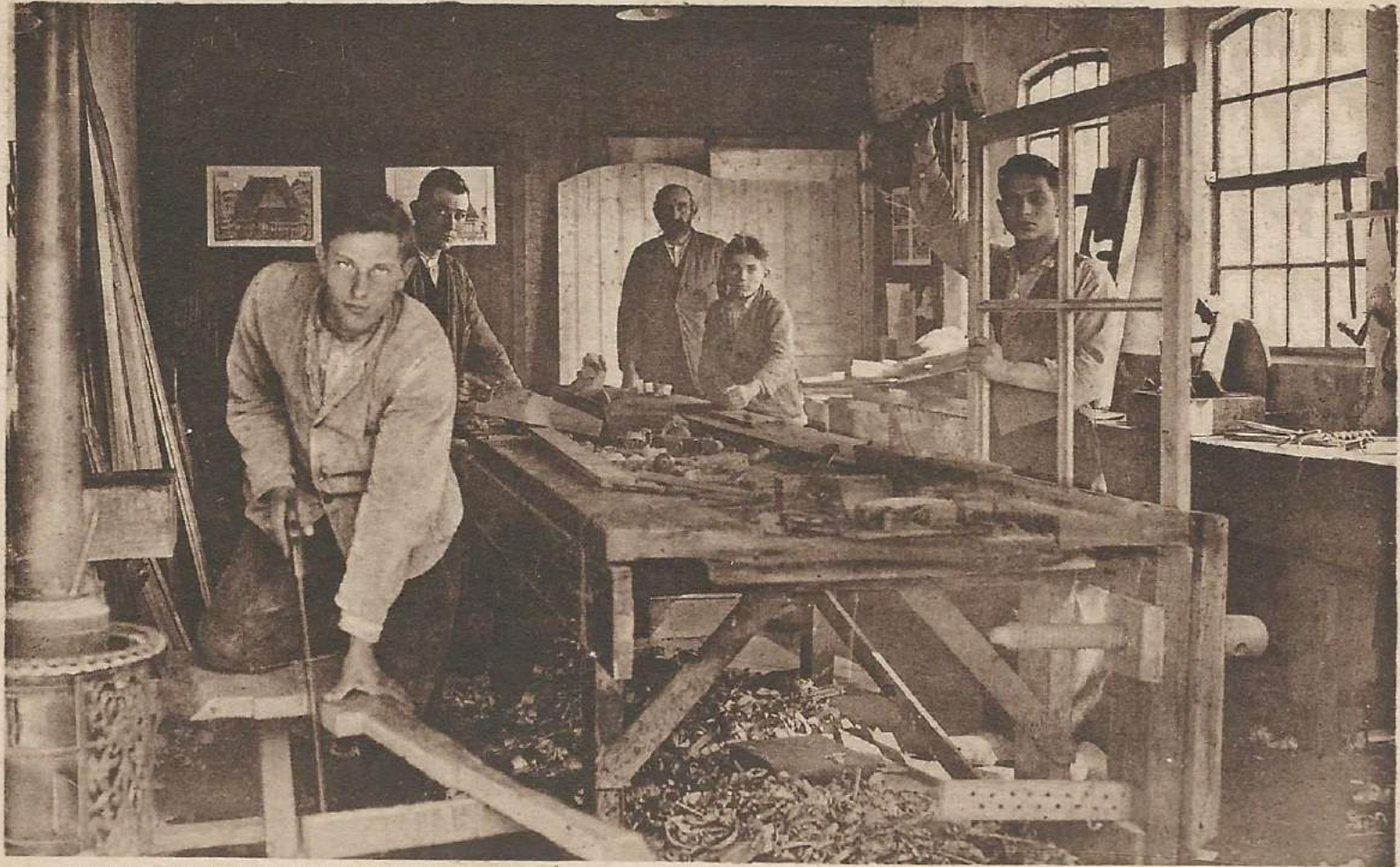
IN DE TIMMERWERKPLAATS.