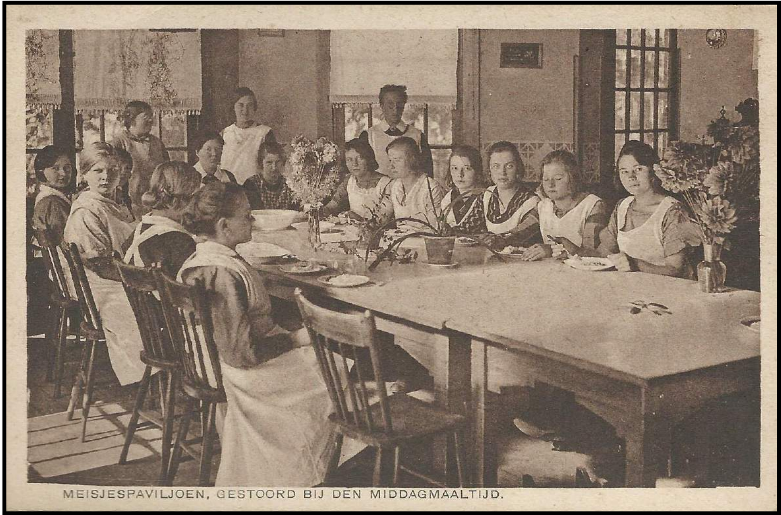
MEISJESPAVILJOEN, GESTOORD BIJ DEN MIDDAGMAALTIJD.