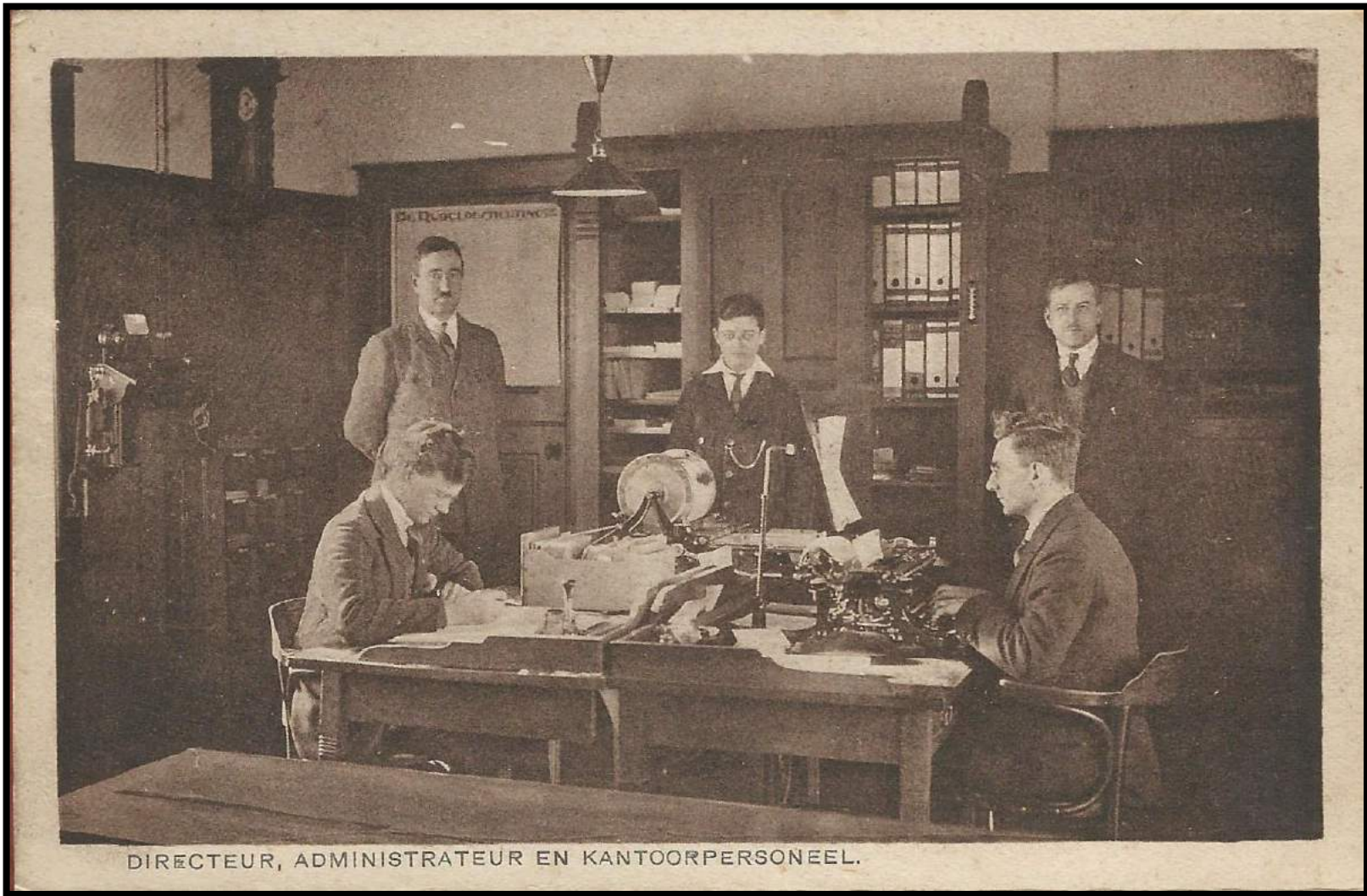
DIRECTEUR, ADMINISTRATEUR EN KANTOORPERSONEEL.