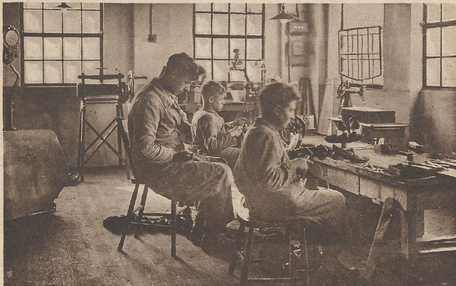
DE SCHOENMAKER MET ZIJN LEERLINGEN