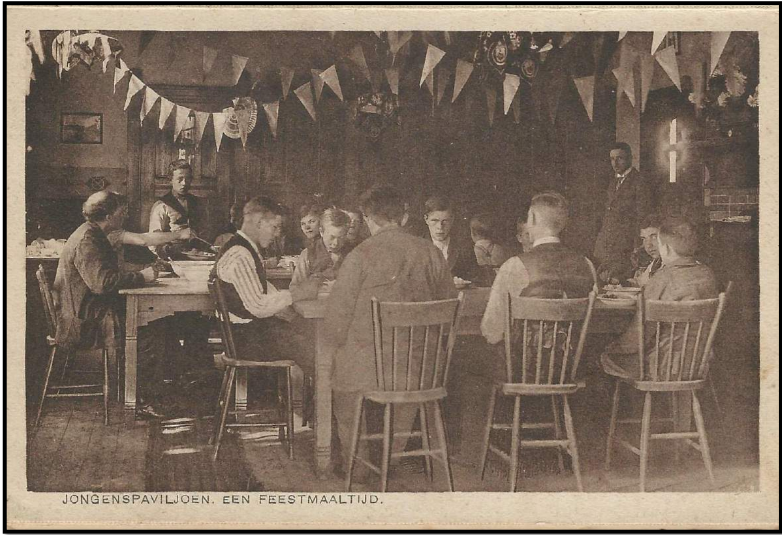
JONGENSPAVILJOEN. EEN FEESTMAALTIJD.