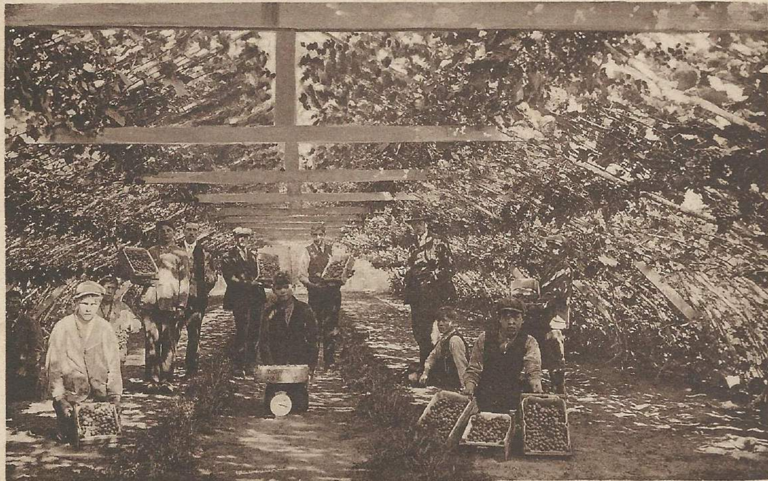
ALS DE DRUIVEN RIJP ZIJN.