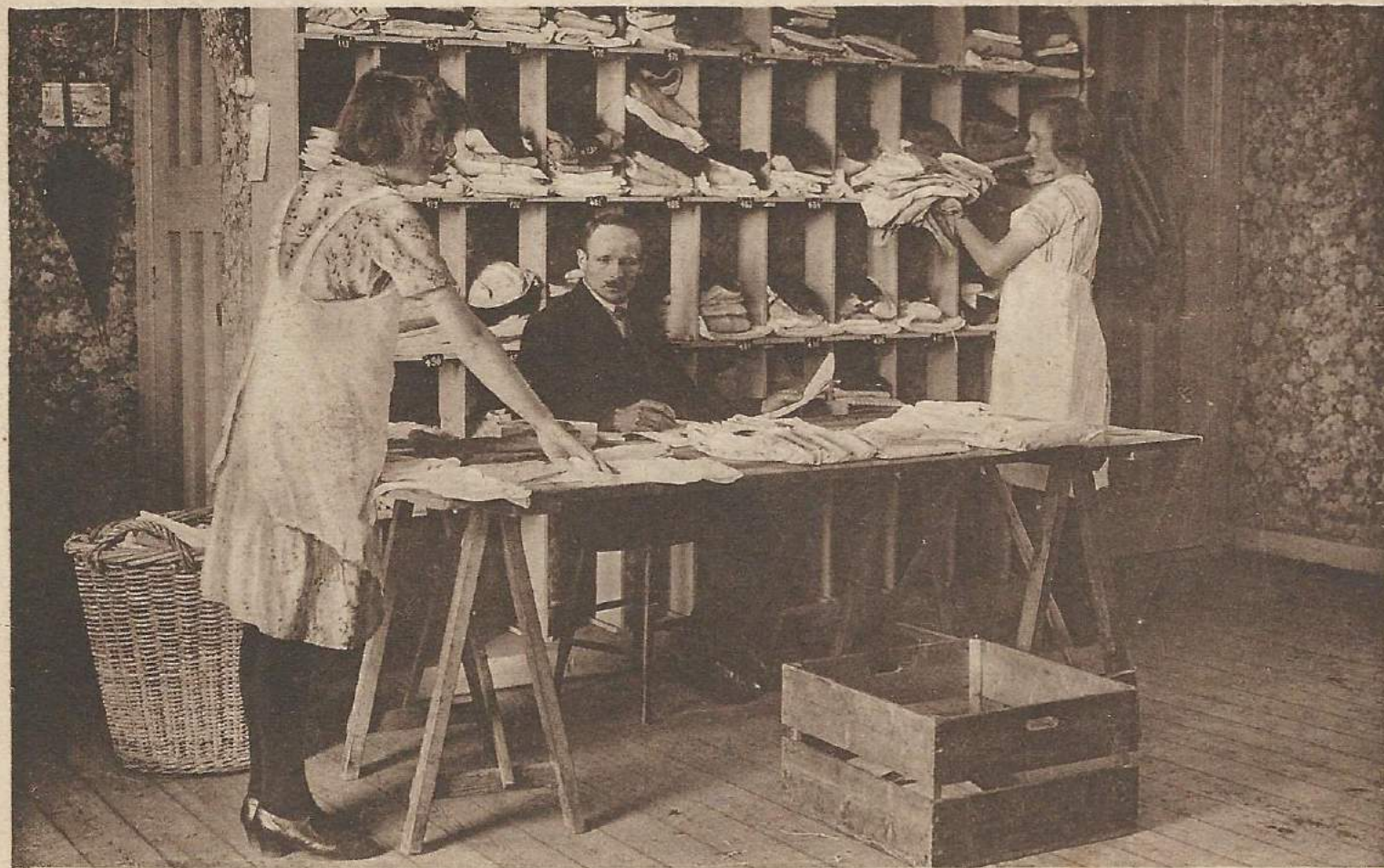
NA BEWASSCHING EN HERSTELLING KRIJGT ELK ZIJN DEEL