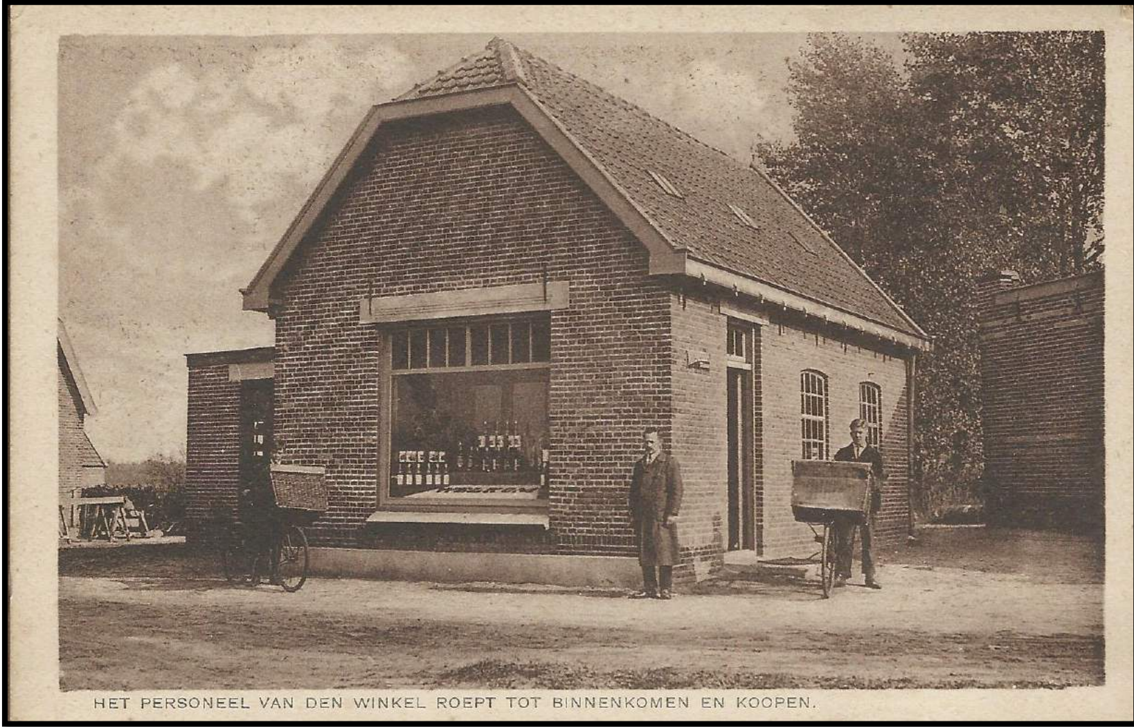
HET PERSONEEL VAN DEN WINKEL ROEPT TOT BINNENKOMEN EN KOOPEN.